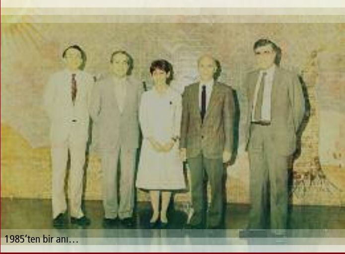
1985'ten bir anı...

ile uzaklarda olduğu tüm zamanlarda ben annemin yanında idim. Aslında ailecek yaşamımızın değişeceği o kara gün, annemiz kucağına beni alarak babamızı geri dönüşü olmayacak yolculuğuna uğurlarken, babamızın benim için söylemiş olduğu "ben dönene kadar bizim küçük kızımız, karabiberimiz yosun gözlü annesi ile yatsın" dileği gerçek olmuş ve ben annem ile aynı yatağı paylaşmış, onun sıcaklığı ile büyümüştüm.