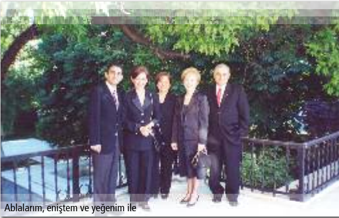
Ablalarım, eniştem ve yeğenim ile