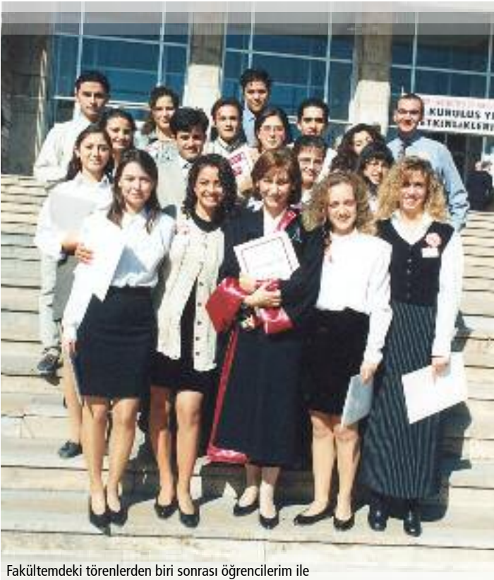
Fakültemdeki törenlerden biri sonrası öğrencilerim ile

yeni bir sayfa açılması ve İstanbul'a yerleşmemiz söz konusu iken, 3 Nisan 1954 tarihinde yaşanan hiç beklenmedik o meşum olay bizim sonraki ve bugüne dek gelen yaşamımızın başlangıcı olmuştur. Bu tarihte Adana-İstanbul seferini yapan yolcu uçağının Toros dağlarının sarp kayalıklarına düşmesi ve bu uçakta bulunan babamızın 37 yaşında elim bir şekilde vefatı, daha sonra ülkemizdeki tarihi kayıtlara Türkiye'nin ilk büyük uçak kazası olarak geçecektir. Ardından, canım annemizin tek başına 27 yaşında iken yüklendiği büyük sorumluluk ile Adana'dan Ankara'ya geliştik, giderek güçlendiğimiz ve olgunlaştığımız, Maltepe Uludağ Sokak'ta geçirdiğimiz hiç unutamayacağımız zorlu ancak güzel ve sıcak komşuluk ilişkilerinin doyasıya yaşandığı çocukluk yıllarımız ile eğitim ve yaşam mücadelemiz başlayacaktır. Maltepe ilkokulu, Namık Kemal Ortaokulu ve Ankara Kız Lisesi'nden sonra, Cumhuriyetimizin ilk tıp fakültesi olan Ankara Üniversitesi Tıp Fakültesine adımımı attığım an çocukluğumdan beri hayallerimde yaşattığım balerin olmak arzumun da sonlandığı bir dönüm noktası olmuştur.