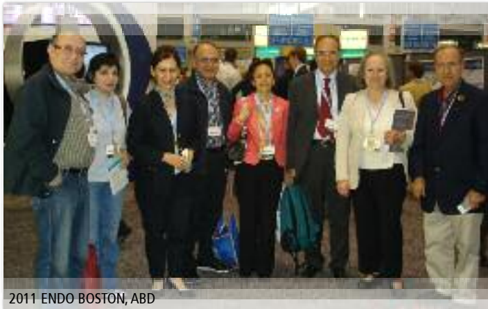
2011 ENDO BOSTON, ABD