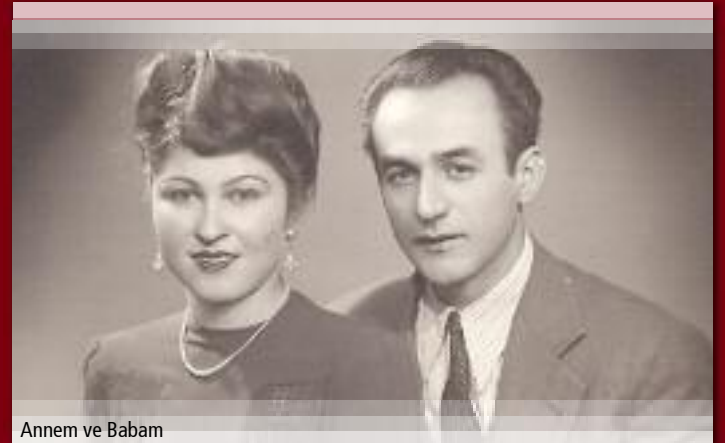
Annem ve Babam