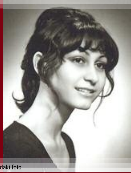
Fakülte yıllarındaki foto

"Doğmak –Yaşamak– Ölmek" üçlemesi kaçınılmaz bir gerçektir yaşam oyununda. Bu gerçeği unutmadan yaşamaktır, in-