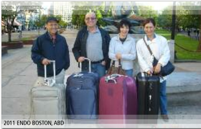
2011 ENDO BOSTON, ABD