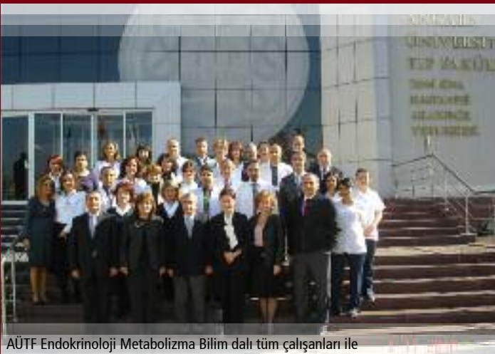
AÜTF Endokrinoloji Metabolizma Bilim dalı tüm çalışanları ile